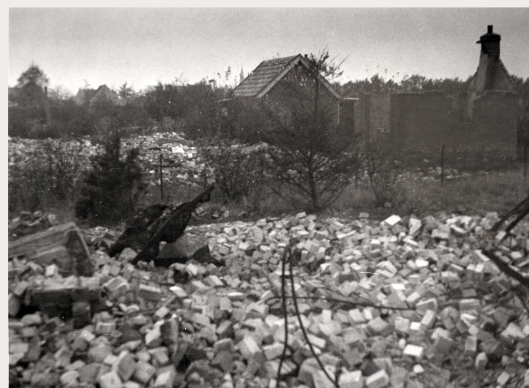
Ausgebrannte und zerstörte Häuser in Putten, Oktober ~, "" .