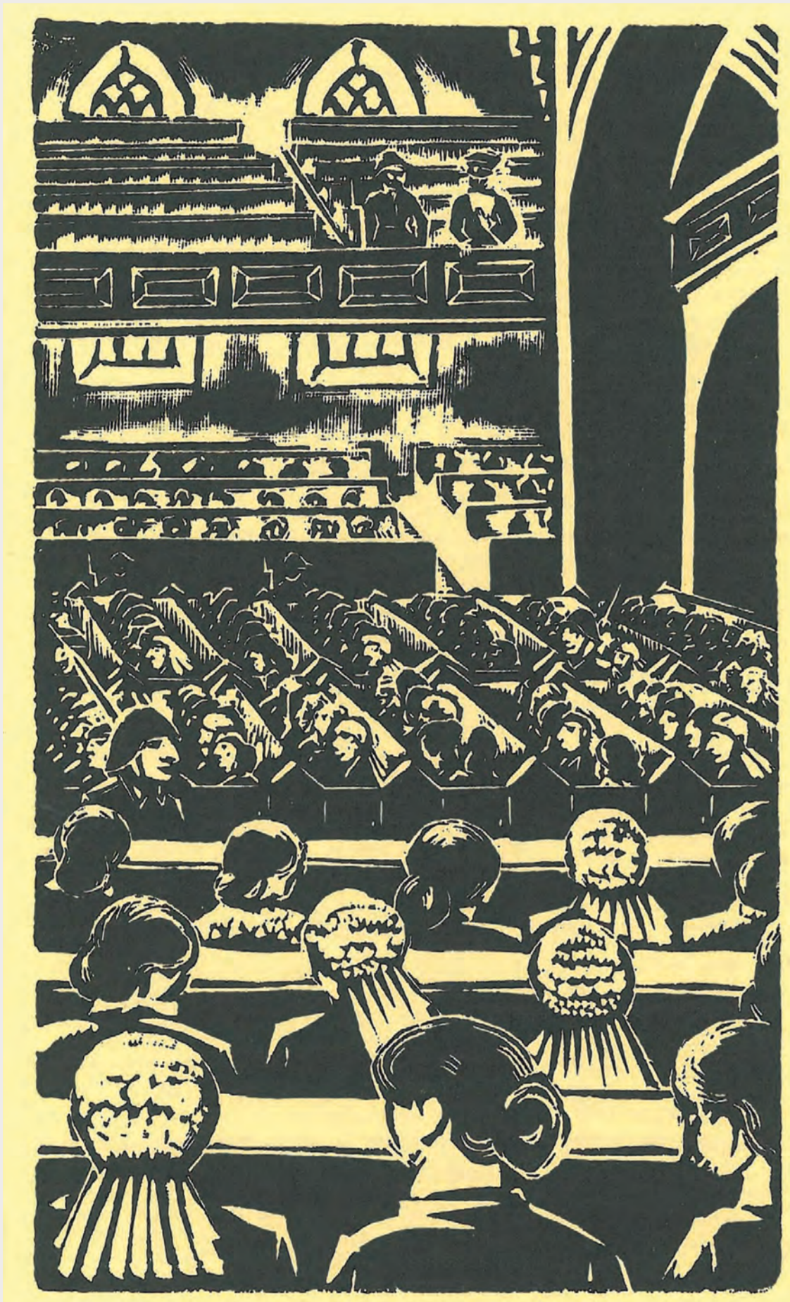
Holzschnitt „Bekendmaking van het vonnis“ (Die Bekanntgabe des Urteils) von Jo Bezaan, nicht datiert.

Die Markierungen geben an, wie viele Männer aus dem jeweiligen Haus verschleppt wurden und wie viele von ihnen zurückkamen. Schraffiert dargestellt sind die zerstörten Häuser.