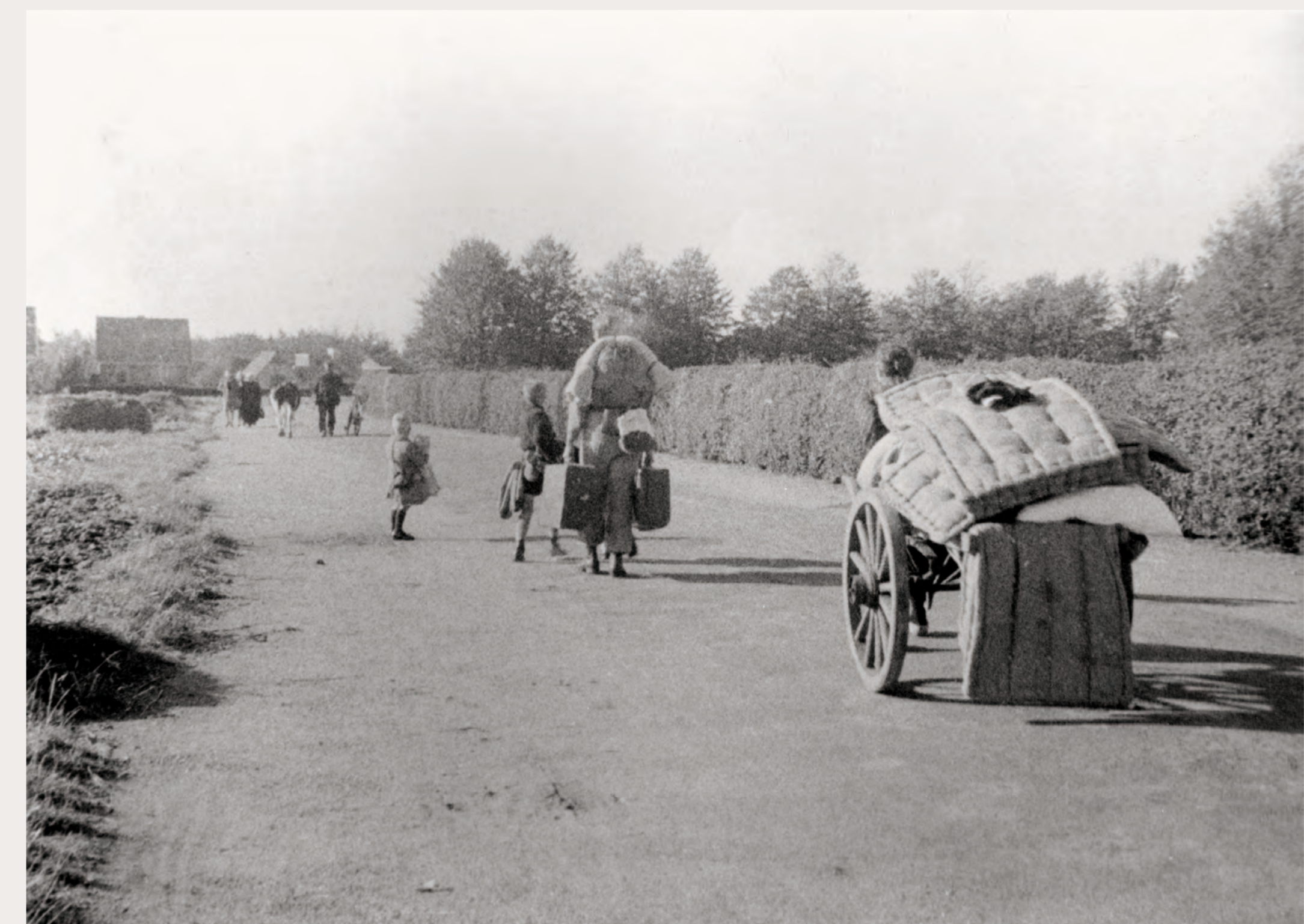
Am ~. Oktober ~, "" müssen zahlreiche Einwohnerinnen und Einwohner Putten verlassen. Ihre Häuser werden in Brand gesetzt.

Am folgenden 2. Oktober ~, "" wurden 65, ° Männer, darunter auch die Geiseln, in das Polizeiliche Durchgangslager Amersfoort gebracht. Deutsche Soldaten vertrieben in einigen Ortsteilen Puttens die Bewohnerinnen und Bewohner aus ihren Wohnungen und setzten mehr als ~ Häuser in Brand.