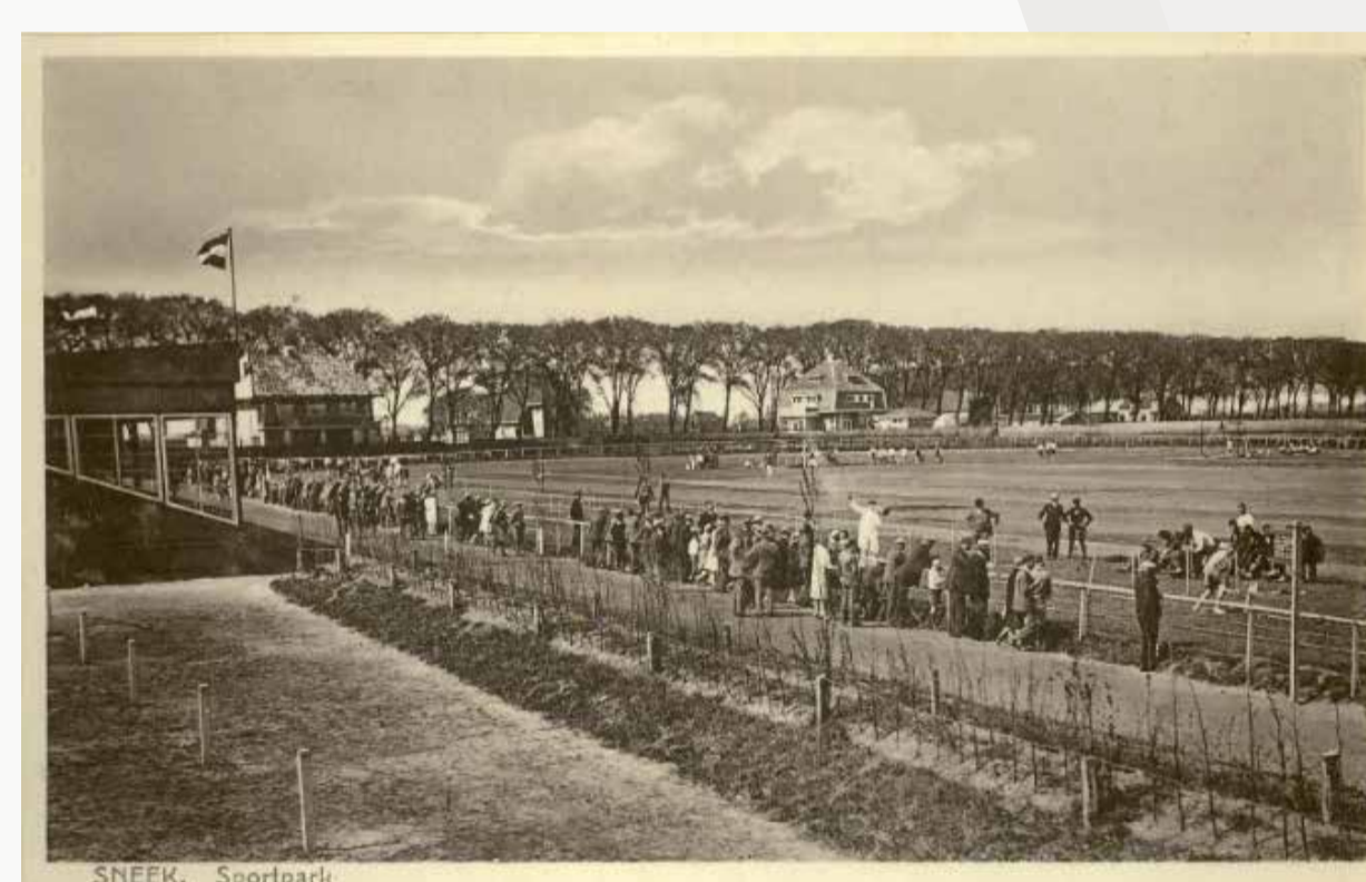
Das Stadion am Leeuwarderweg in Sneek, nicht datiert.

Die Befürchtungen trafen zu. Während im Stadion ca. 10 000 Menschen das Spiel verfolgten, umstellten deutsche Soldaten bereits zur Halbzeit die Sportstätte. Nach Ende der Partie überprüften sie am Ausgang die Personalien aller Männer. Gesucht wurden jene, die sich einem Arbeitseinsatz in Deutschland bis dahin entzogen hatten. Es wurden 24 Verhaftungen vorgenommen. Zu den Verhafteten gehörte auch Willem Rienstra.