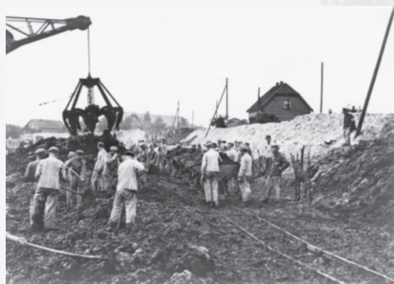
Häftlinge des KZ Neuengamme bei der Schiffbarmachung der Dove Elbe, 1941 oder 1942