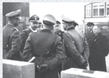
Reichsführer SS Heinrich Himmler (2. v.l.) bei der Besichtigung der alten Ziegelei in Hamburg-Neuengamme, Januar 1940

Hamburg's political and economic interests combined with the ambitions of the SS to efficiently use prisoner labor lay behind the establishment of the Neuengamme concentration camp. The City wanted cheap building material for the implementation of the Nazi development plans for a "New Hamburg". It granted the SS a one million Reichsmark loan for the construction of a modern brick factory. Moreover, the City provided the land for the extension of the camp and for clay mining, and it took over the construction of railroad tracks to the camp as well as a navigable waterway to the Hamburg port. In December 1938, the first prisoners were housed in an old brick factory and started brick production. In 1940 they started building the camp huts and a new brick factory.