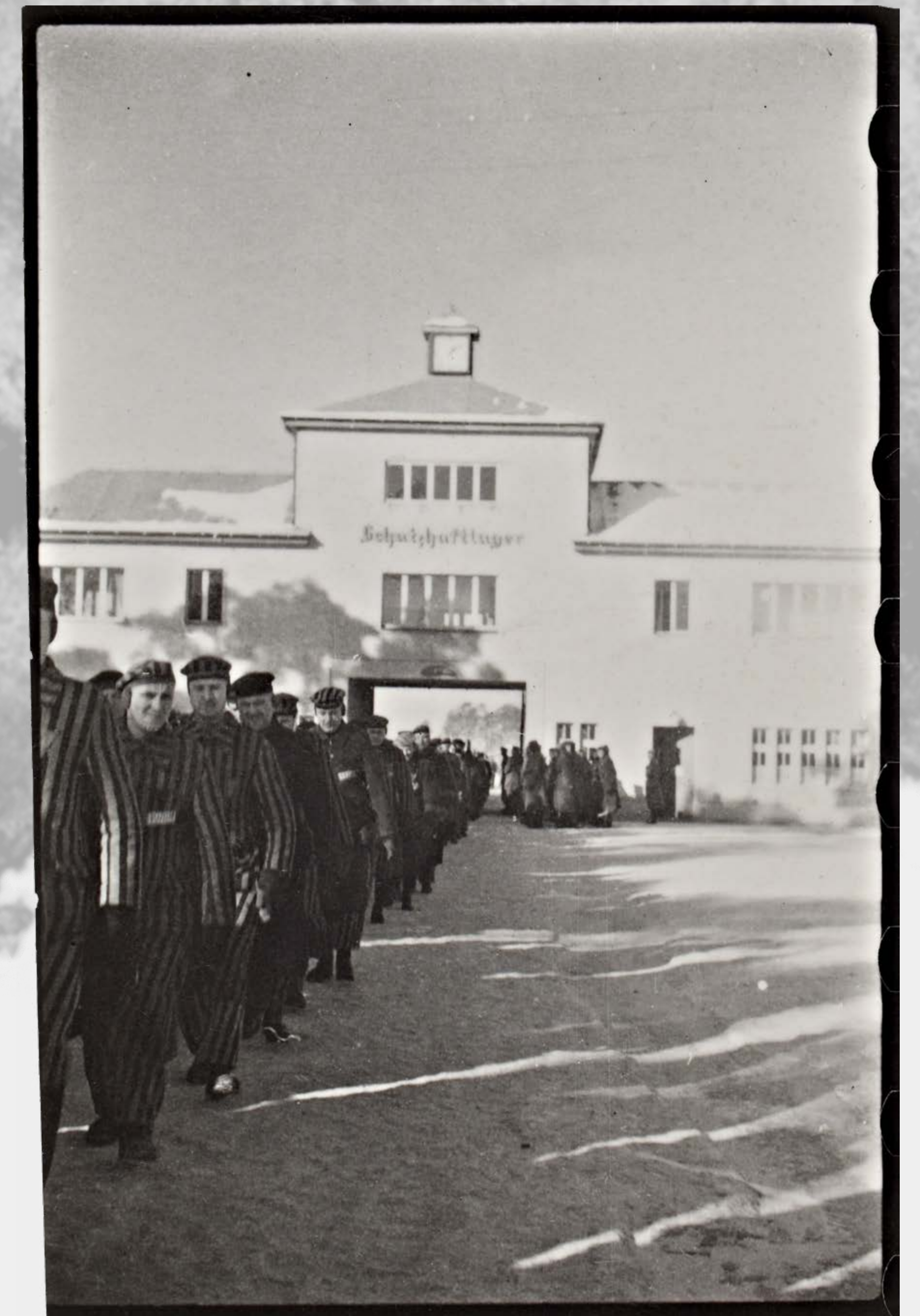
Häftlinge des KZ Sachsenhausen beim Marsch aus dem Lager zum Arbeitseinsatz, Februar 1941