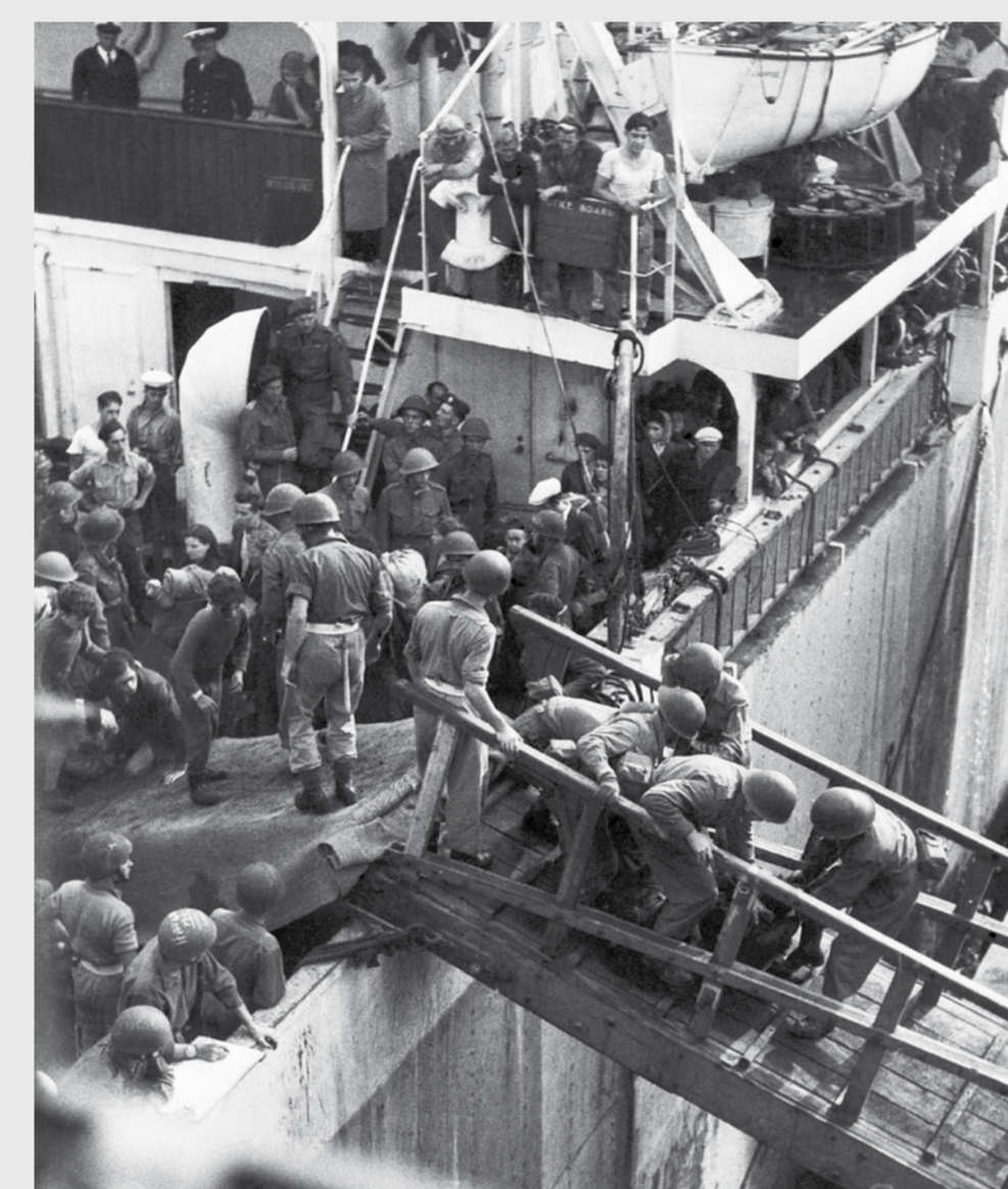
Britische Soldaten zwingen Passagiere der »Exodus« im Hamburger Hafen von Bord eines Frachtschiffs, 9. September 1947.