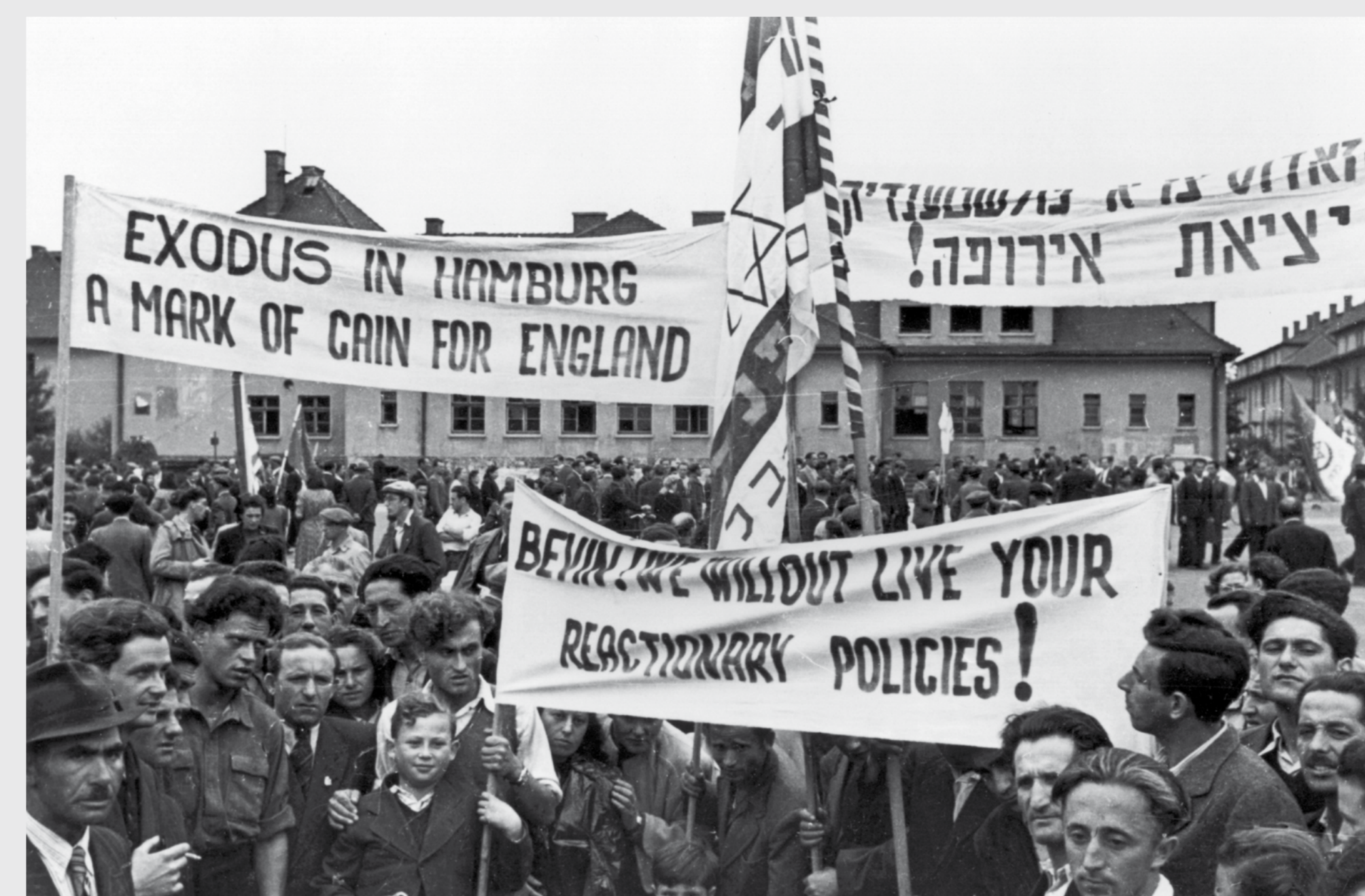
Protest im DP-Camp Belsen gegen die angekündigte Räumung der Schiffe mit den Passagieren der »Exodus« im Hamburger Hafen, vermutlich 7. September 1947

Foto: Ursula Litzmann, akg-images, 124356