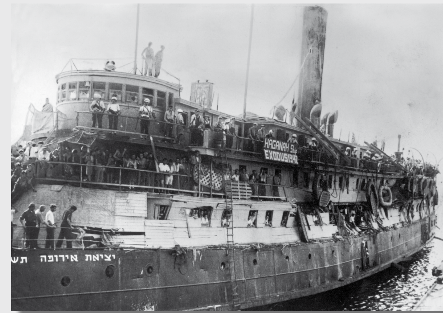
Passagiere unter Bewachung britischer Soldaten auf der stark beschädigten »Exodus« im Hafen von Haifa, Juli 1947

This move by the British authorities provoked protests worldwide, contributing to the UK's decision to terminate the British Mandate for Palestine. The independent State of Israel was proclaimed on 14 May 1948.