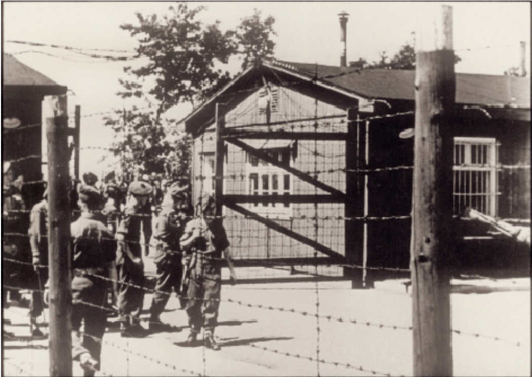
Soldats britanniques à l'entrée du camp, 2 juin 1945. Arrêt sur image, extraite du matériel cinématographique britannique du lieutenant Thompson.