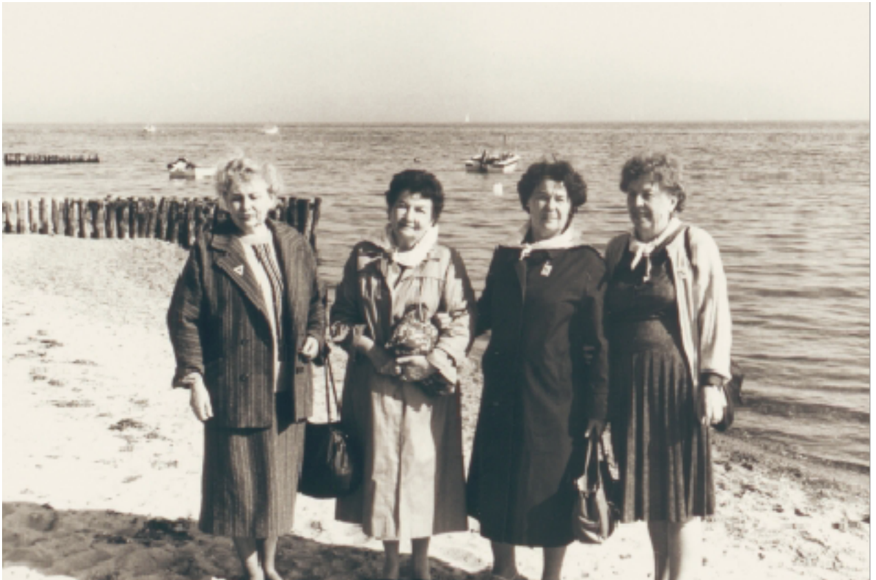
Polonaises se rendant en pèlerinage sur la grève de Neustadt, 1989. Foto: Jörn Tiedemann. (ANg)