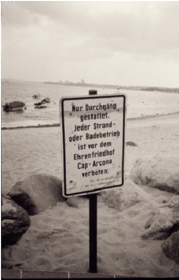
Neustadt, sur la plage devant le cimetière commémoratif « Cap Arcona ».