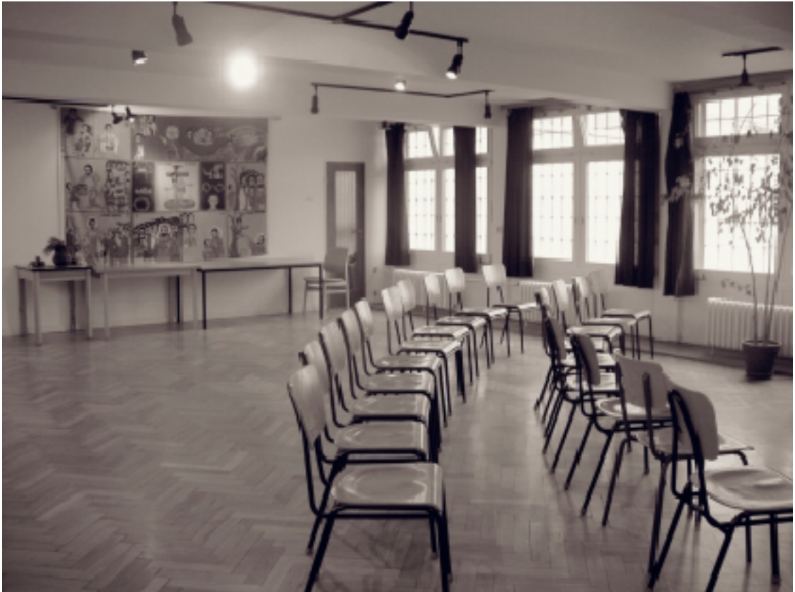
The chapel at Vierlande Penal Facility, January 2004. Foto: Christiane Heß. (ANg)