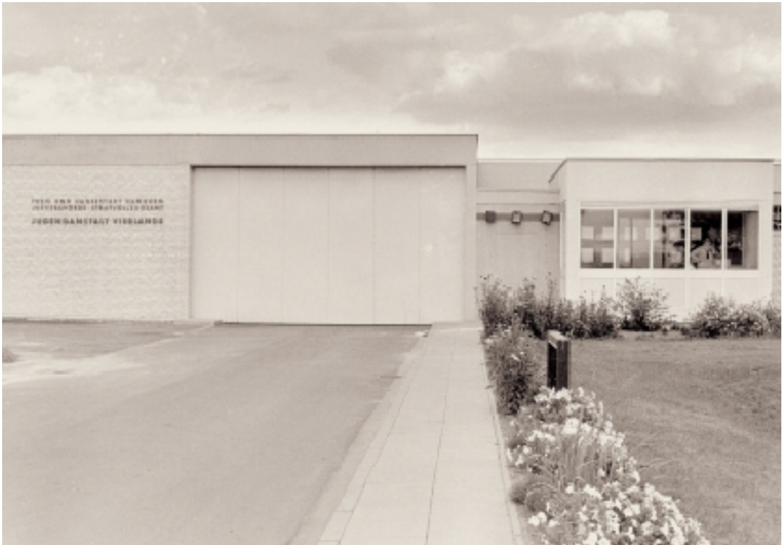
The gate to Vierlande Juvenile Detention Centre in the 1970s.