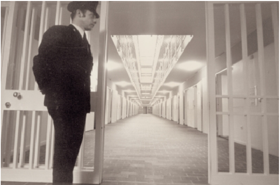
View of the different floors of the prison building from the ground floor, 1970.