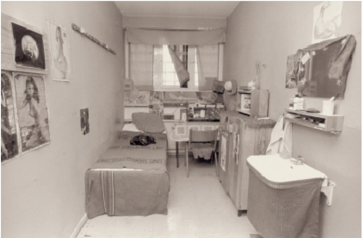
A cell in the prison building of the juvenile detention centre, 1970s.