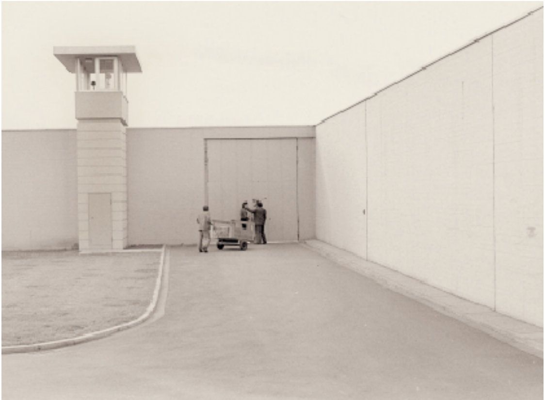
View of the second gate to the courtyard and the northern watchtower, 1970s.