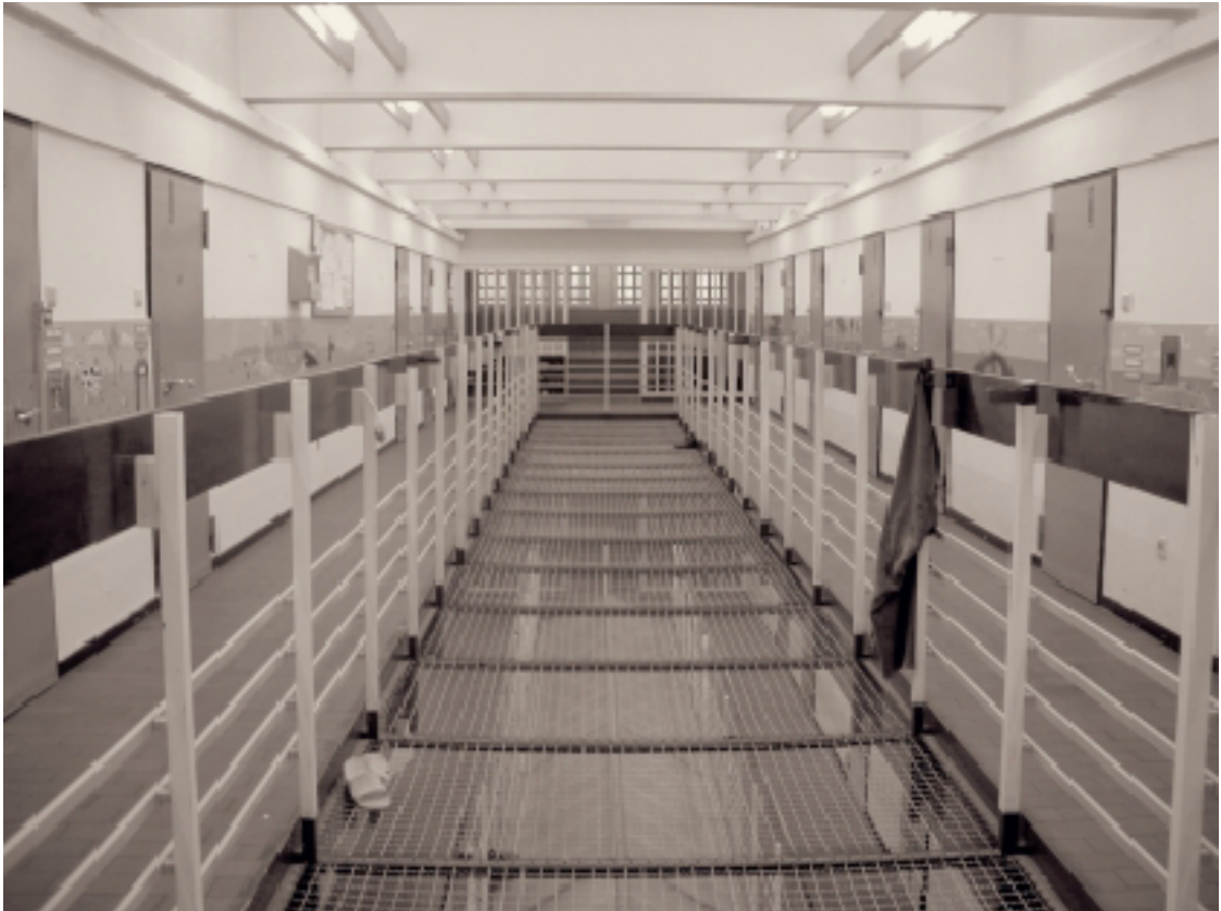
A drug-free ward at Vierlande Penal Facility, January 2004. Foto: Christiane Heß. (ANg)